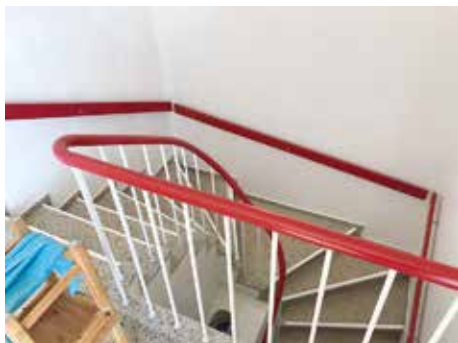
Den nyistandsatte åbne trappegang.